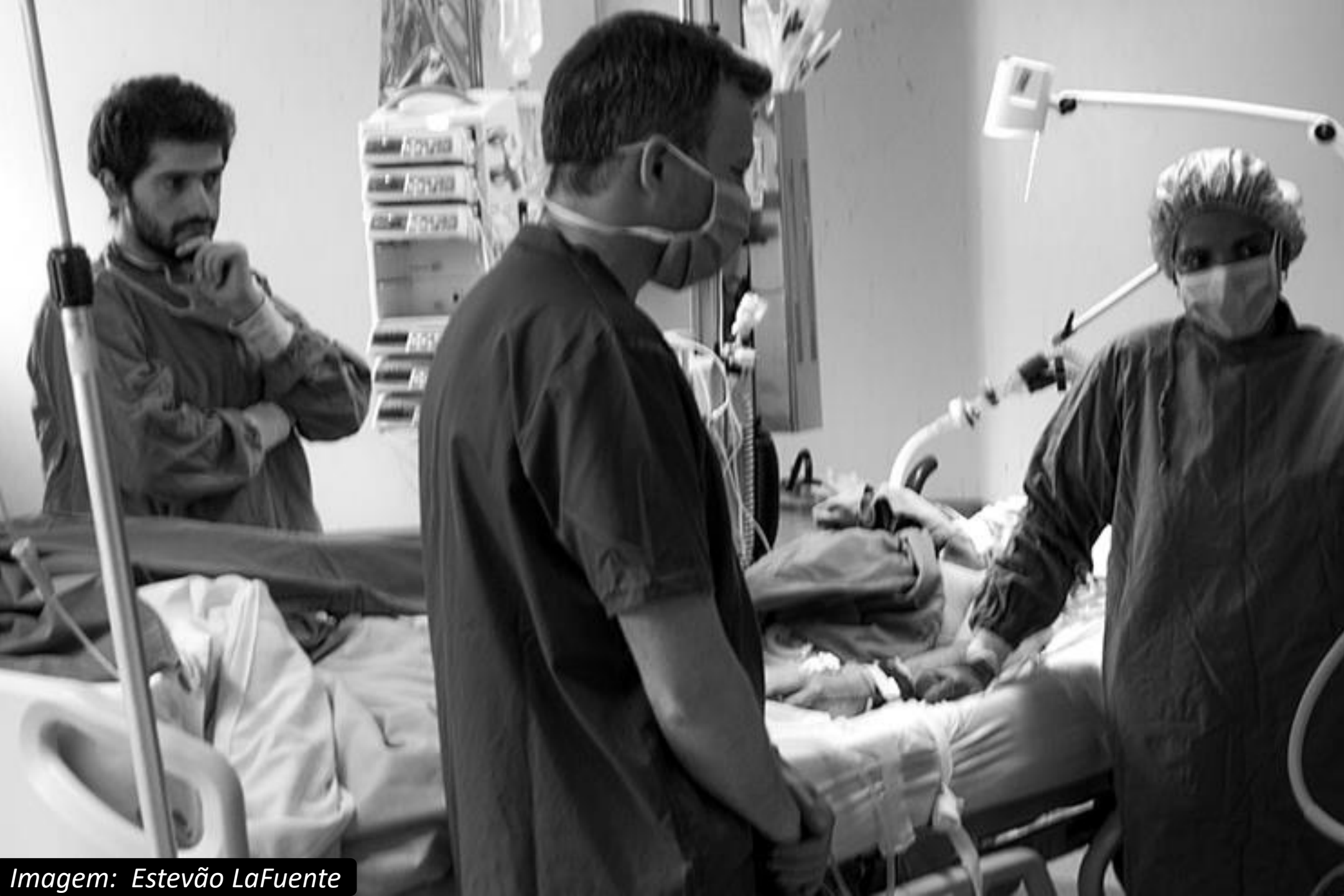
Imagem: Estevão LaFuente